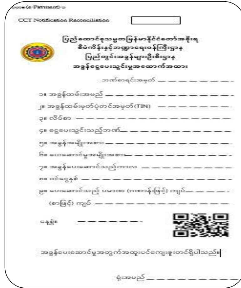
ပုံ(၂) ပြည်တွင်းအခွန်များဦးစီးဌာန၏ လုံခြုံမှုအဆင့် (QR Code)